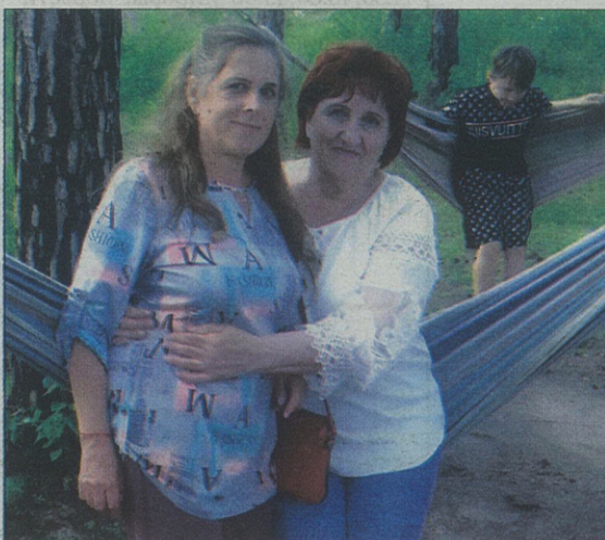
■ Дружба крепкая не сломается, не расклеится от дождей и вьюг!