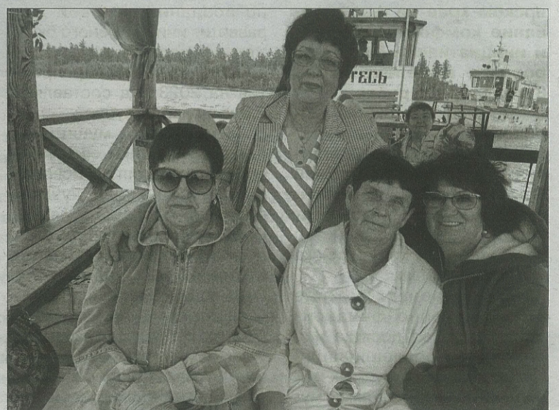
■ По водохранилищу - к затопленным деревням