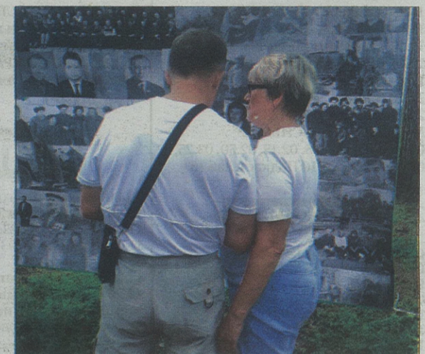
■ До глубины души трогают старые фотокарточки