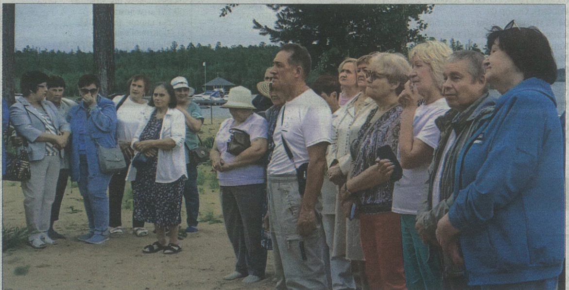
■ Почти 150 человек собрались на территории городского пляжа, чтобы увидеть дорогие сердцу лица односельчан